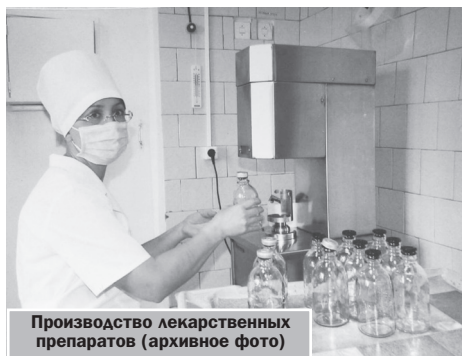
Производство лекарственных препаратов (архивное фото)

Основная задача аптеки КБ №3 сегодня – обеспечение отделений больницы лекарственными средствами, предметами санитарии, гигиены, медицинскими иммунобиологическими препаратами, расходными материалами, перевязочными и дезинфицирующими средствами, экстремальными лекарственными формами. На ее снабжении – круглосуточный стационар на 110 коек, аптека обеспечивает