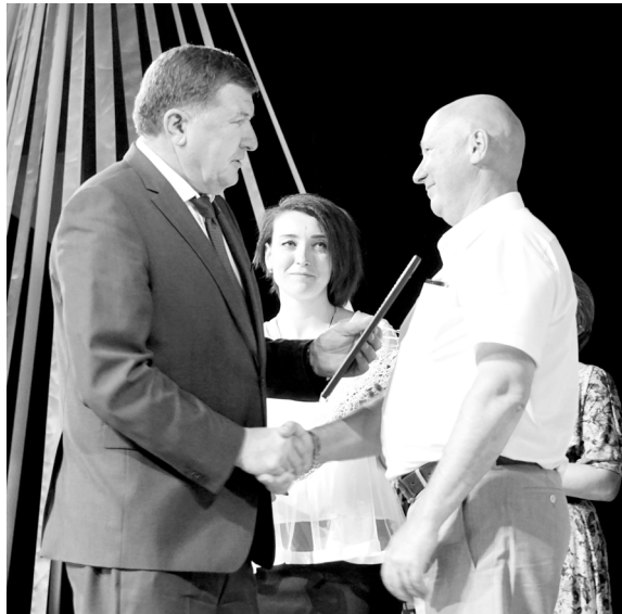
шести медицинским работникам были вручены Благодарственные письма Губернатора Забайкальско-